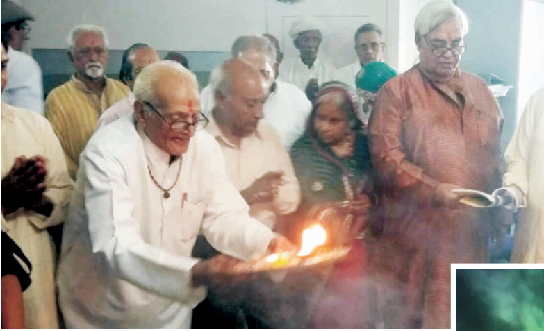
आनन्द वृद्धाश्रम वासी लक्ष्मी पूजन करते हुए

दीपावली के शुभ अवसर पर वृद्धजन आतिषबाजी का आनन्द उठाते हुए।