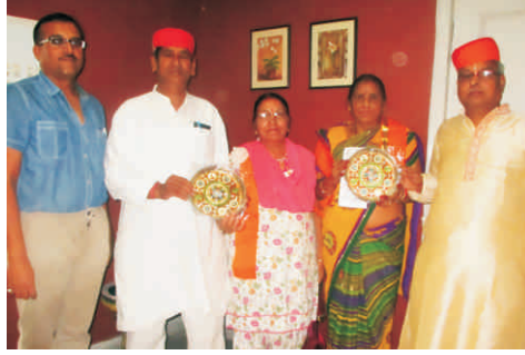
बी.आर. ज्वेलर्स मैन रोड, पहाड़गंज, नई दिल्ली