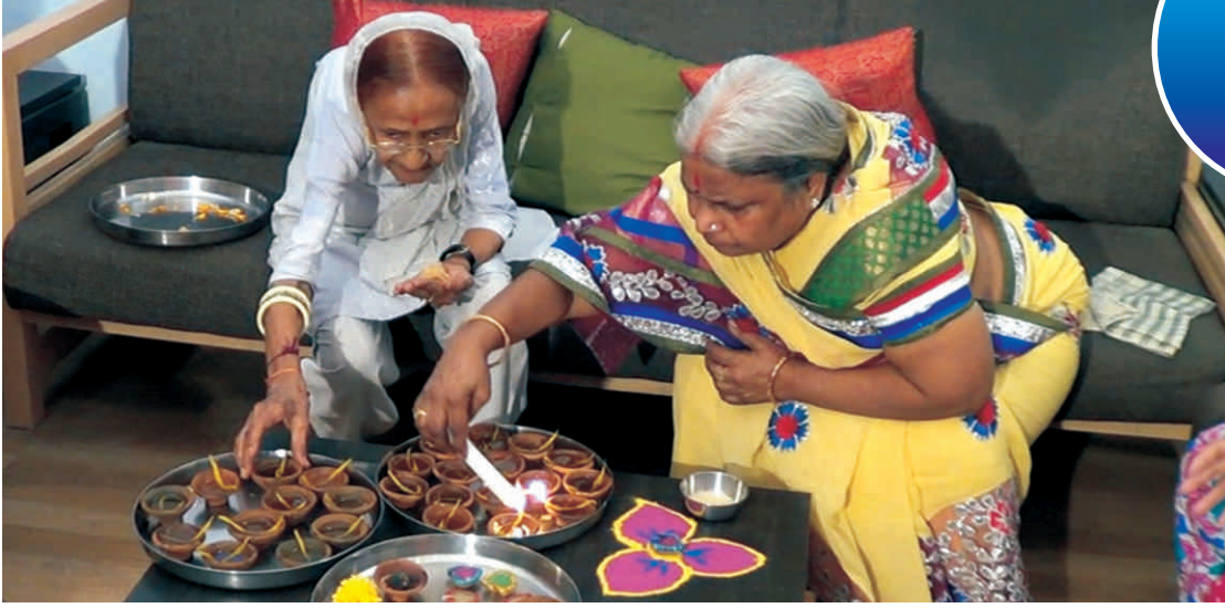
वृद्धाश्रम की बुजुर्ग महिलाएँ दीप जलाते हुए....

एक वृद्ध सहयोग राशि रु. 5000/- प्रति माह